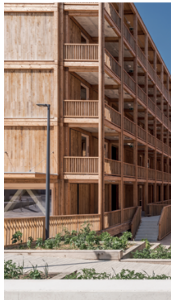
1 er prix romand, Centre d'hébergement colle

Parmi les quatre-vingt-cinq projets soumis en Suisse romande, les deux lauréats genevois illustrent bien la diversité de mise en œuvre du bois. Premier prix, le Centre de Rigot de l'Hospice général, adapté à l'accueil de 370 migrants, fait l'éloge du tout bois local qui a été utilisé depuis les fondations jusqu'à la toiture. Conçu par l'Atelier d'architecture genevois ACAU selon une stratégie «zéro béton», le complexe sis à l'avenue de France est une construction provisoire, autorisée à occuper le site pour dix ans. Composée de deux barres de cinq niveaux délimitant une cour intérieure, elle est constituée d'éléments modulaires préfabriqués, démontables et réutilisables. Les 7000m 2 de surface se répartissent en 230 modules nécessaires à la création de logements flexibles, du studio au 4 pièces, selon les besoins. Les cursives extérieures déployées en vis-à-vis génèrent une ouverture perméable à l'échange. Les façades extérieures sont bardées de chêne genevois laissé brut de sciage. «L'exploitation optimale de la construction bois indus-