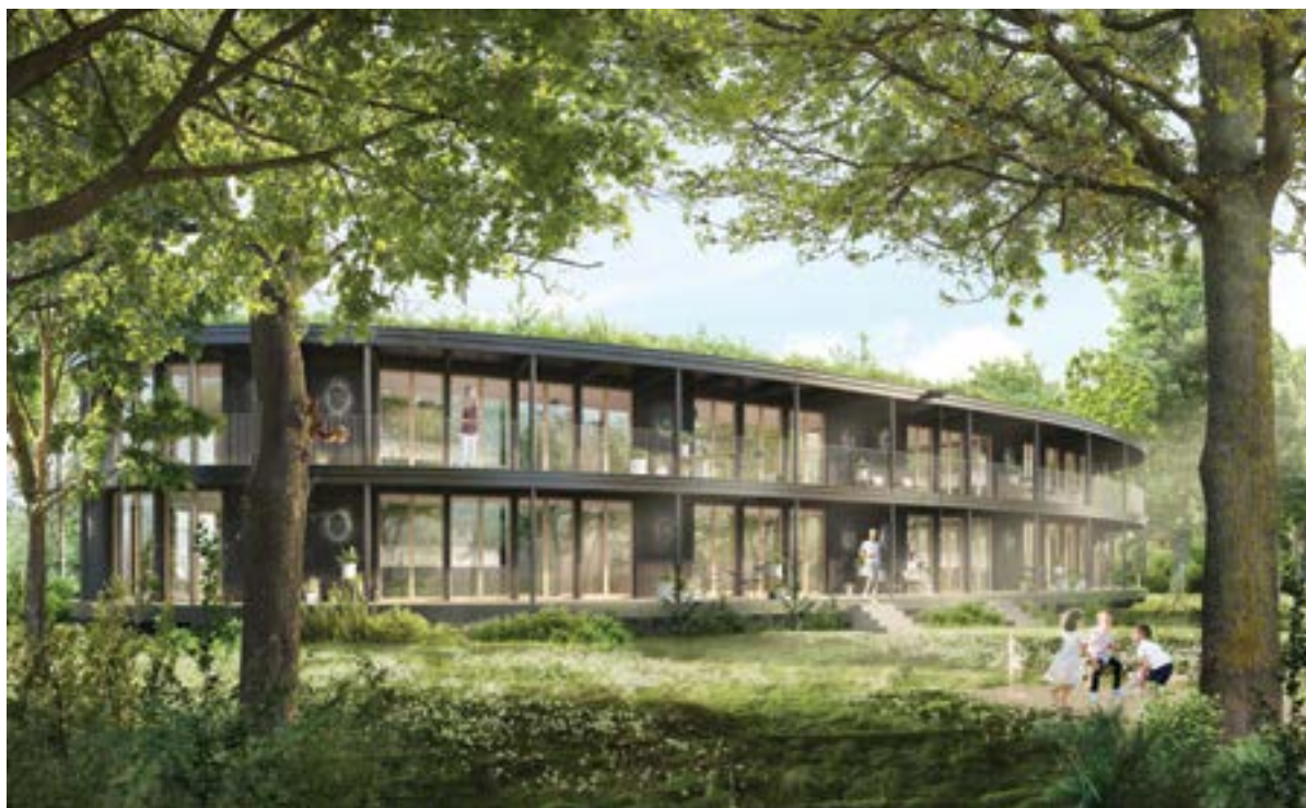
Le projet Oval Housing à Carouge.

Avec une même philosophie du travail, nous finissons toujours par trouver ensemble les meilleures solutions